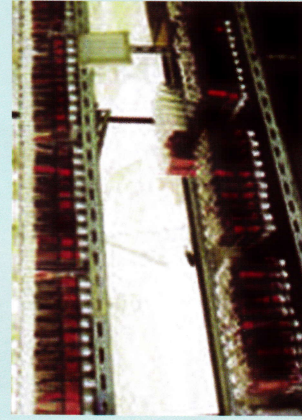
ลักษณะการผลิตขยายแตนเบียนไซทริโคแกรมมา ในหลอดแก้วของศูนย์ส่งเสริมเทคโนโลยีการเกษตร ด้านอารักขาพืช จังหวัดเชียงใหม่

แตนเบียนไซทริโคแกรมมามีขนาดเล็กมาก ความยาวจากรังหัวถึงปลายส่วนท้องตัวเต็มวัยเพศผู้และเพศเมีย เฉลี่ย 0.4 และ 0.36 มม. ตามลำดับความกว้างเมื่อกางปีกออกของตัวเต็มวัยเพศผู้และเพศเมียประมาณ 0.87 และ 0.93 มม. ตามลำดับ ตัวเต็มวัยจะมีขนาดเล็กลดสีแดง ขนาดเป็นปล้อง