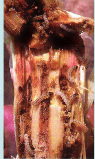
หนอนกออ้อย