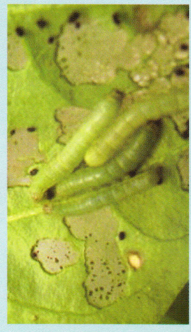
หนอนคืบตะฟุ้ง