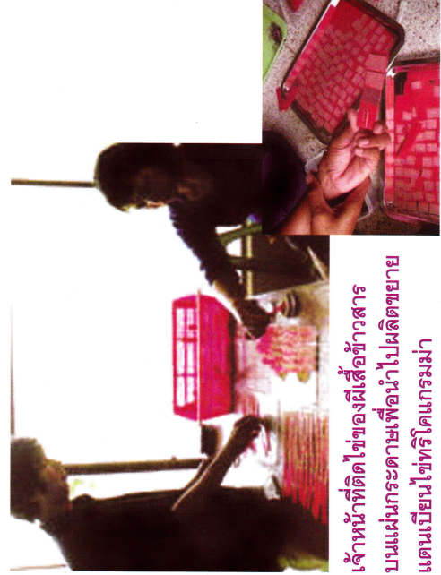
เจ้าหน้าที่ดีไซของฝัเสื้อข้าวสารบนแผนกระดามเพื่อนำไปผลิตขยายแตนเบียนไซทริโคแกรมมา

แตนเบียนไซทริโคแกรมมา จัดเป็นแมลงศัตรูธรรมชาติที่มีความสำคัญมากอีกชนิดหนึ่ง ศัตรูพืชที่ถูกแตนเบียนไซทริโคแกรมมาทำลาย ได้แก่ ไซหนอนกออ้อย ไซหนอนกอข้าว ไซหนอนเจาะสมอฝ้าย และไซของหนอนกระทู้ เป็นต้น ตัวเมียของแตนเบียนไซทริโคแกรมมา จะวางไข่ในไข่ของแมลงศัตรูพืช ทำให้ไข่ไม่ฟักออกเป็นตัว แต่จะฟักออก เป็นแตนเบียนไซทริโคแกรมมาแทนการใช้แตนเบียนไซทริโคแกรมมา ในช่วงศัตรูพืชระบาดจะช่วยลดปริมาณไข่ของแมลงศัตรูพืชลงได้มากถึง 85 เปอร์เซ็นต์ การใช้แตนเบียนไซทริโคแกรมมาจึงเป็นการชดเชยการเคมี และยังไม่มีสารพิษตกค้างในผลผลิต ไม่มีผลกระทบบต่อสภาพแวดล้อม