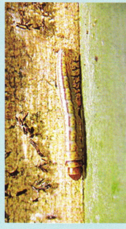
หนอนหัวดักมะพร้าว

แตนเบียนไซทริโคแกรมมาเป็นแมลงเบียนที่ทำลายไซของหนอนฝัเสื้อได้หลายชนิดคือ ไซหนอนหัวดักมะพร้าว ไซหนอนเจาะสมอฝ้าย ไซหนอนกออ้อย ไซหนอนกอข้าว ไซหนอนม้วนใบข้าว ไซหนอนเจาะลำต้นข้าวโพด ไซหนอนใยผัก ไซหนอนแก้วส้ม ไซหนอนคืบตะฟุ้ง ไซหนอนม้วนปากขาว ไซหนอนคืบกะหล่ำปลี เป็นต้น