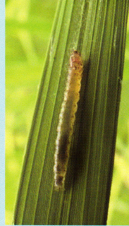
หนอนกอข้าว